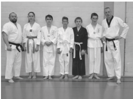
Trainer und Schüler nach der Urkundenverleihung am 14.12.2017: